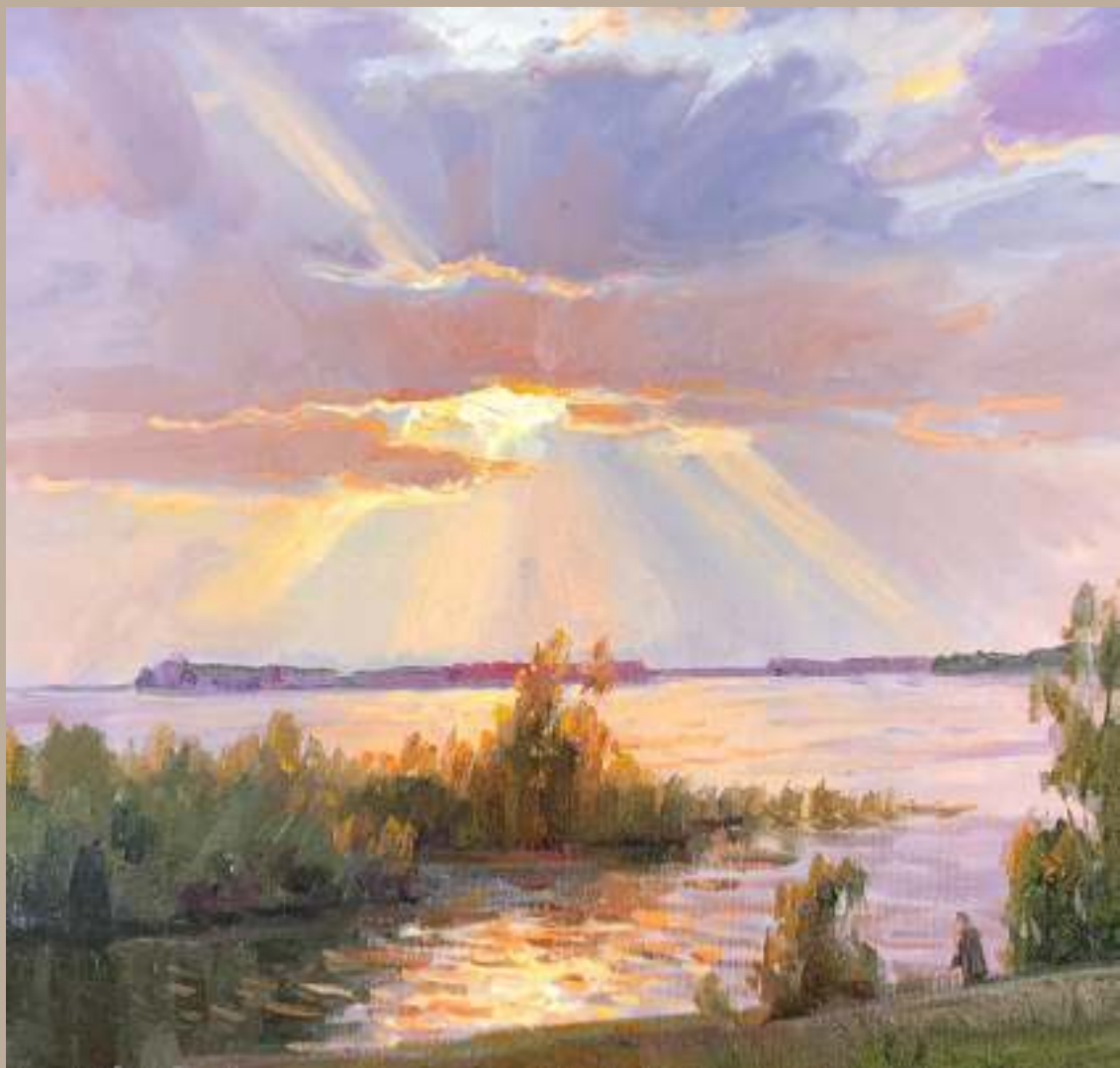
Викентий ЛУКИЯНОВ. «ВЕЧЕР НА КАМЕ», х.м., 50×60