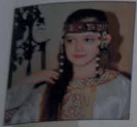
Россия г. Оренбург Произведения автора читайте на стр. 160, 183

Член Литературного объединения им. С.Т. Аксакова «Аленький цветочек». Публиковалась в журналах «Гостиный Двор», «Вера, надежда, любовь», «Православный духовный вестник», «Путеводная звезда», «Великороссь», альманахах «Отчий Дом», «Арина НН», «Общеписательской Литературной газете», сборнике «Волшебное перо» и др.