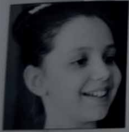
Россия г. Оренбург Произведения автора читайте на стр. 161, 184

Член Литературного объединения им. С.Т. Аксакова «Аленький цветочек». Публиковалась в журналах «Гостиный Двор», «Вера, надежда, любовь», «Православный духовный вестник», «Путеводная звезда», «Великороссь», альманахах «Отчий Дом», «Арина НН», «Общеписательской Литературной газете», сборнике «Волшебное перо» и др.